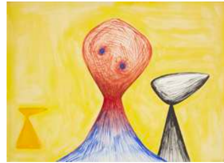
Alexander CALDER (1898-1976) Composition , 1943, gouache et encre sur papier

- Le régime des plus-values sur biens meubles (sur option du vendeur) : si le vendeur y a intérêt et dispose de documents justifiant le prix et la date d'achat, il pourra choisir le régime des plus-values. Dans ce cas, le taux est de 36,2% (soit 19% au titre de l'impôt sur le revenu et 17,2% au titre des prélèvements sociaux) et s'applique au montant de la plus-value (et non au prix de cession) après un abattement de 5% par année au-delà de la 2 e année. Par conséquent, après 22 ans de détention, la cession est exonérée.