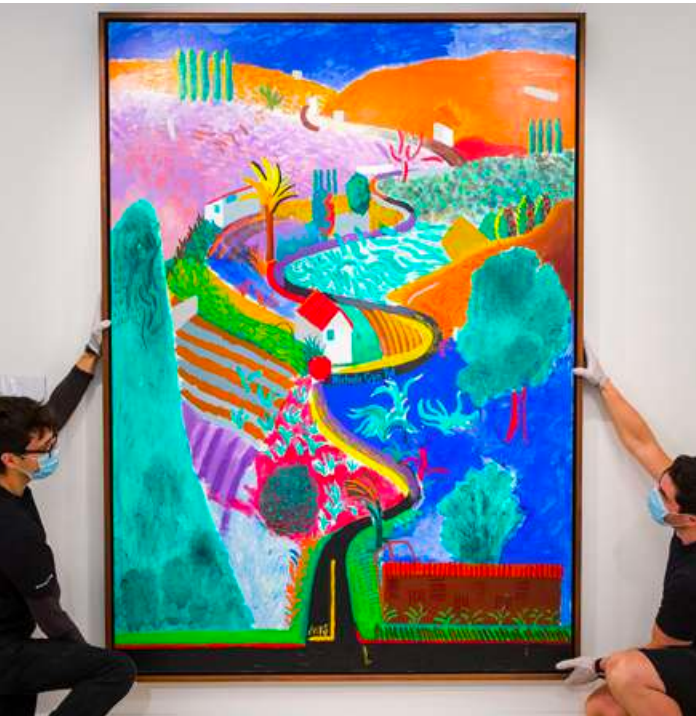
David Hockney, Nichols Canyon (1980)

↑ En 2019, Hockney pointait à la dixième place du classement des plus belles enchères. Le 7 décembre dernier, ce paysage, Nichols Canyon était adjugé plus de 33 millions d'euros par la maison Phillips à New York.