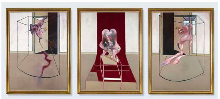
Francis Bacon, Inspired by the Oresteia of Aeschylus (1981)